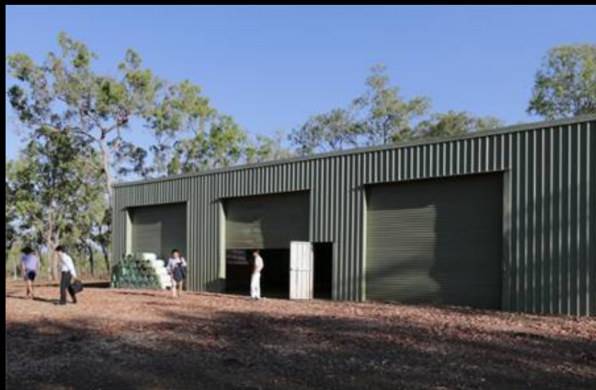
機材置き場に使える倉庫