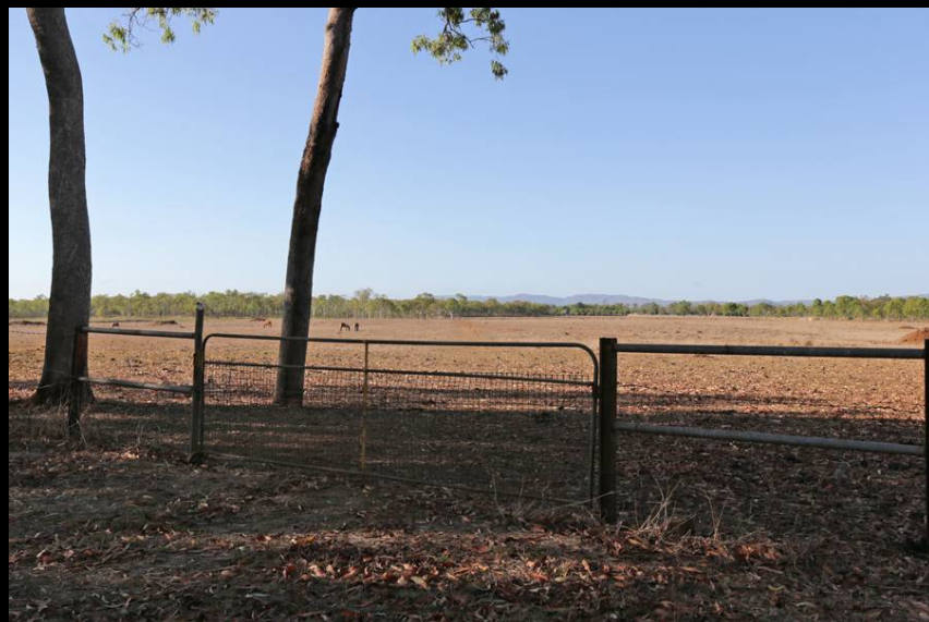
柵の奥が観測場所、広さは充分