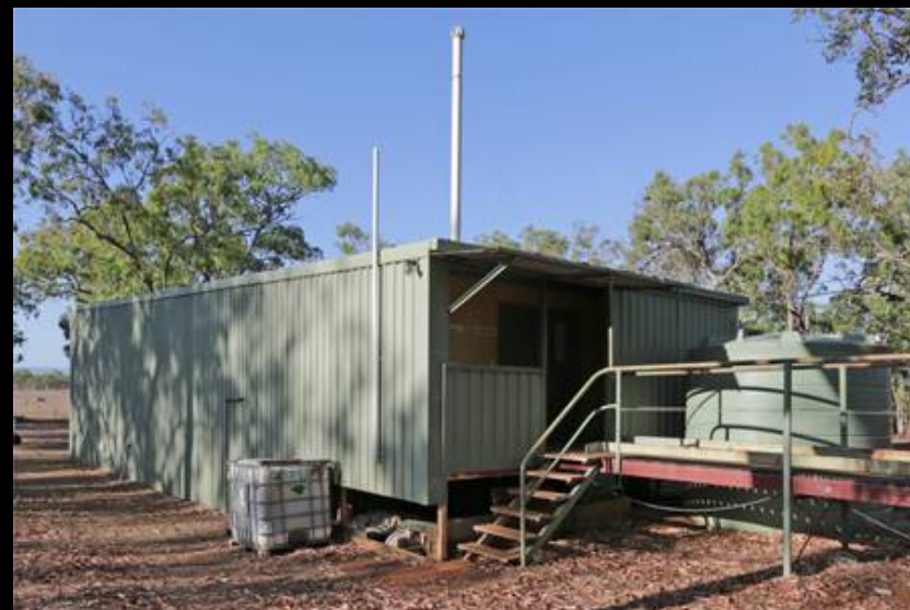
倉庫の裏がトイレ(もちろん男女別)