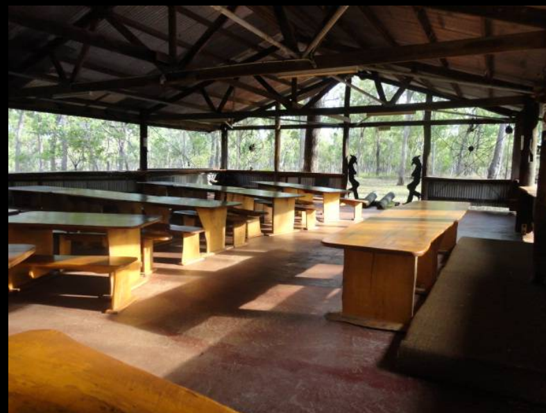
屋根のある休憩スペース