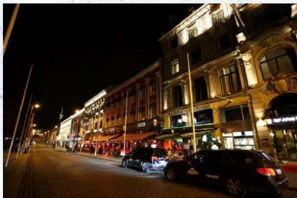
Karl Johans gate