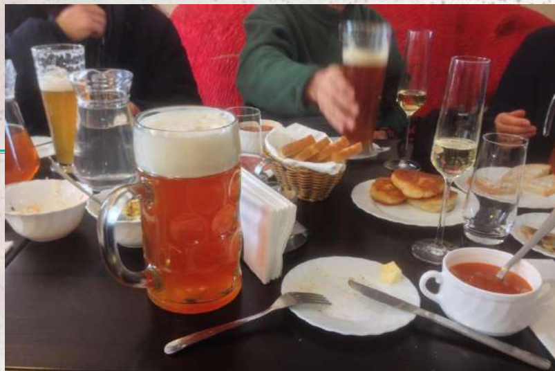
祝勝会の1リットルビール