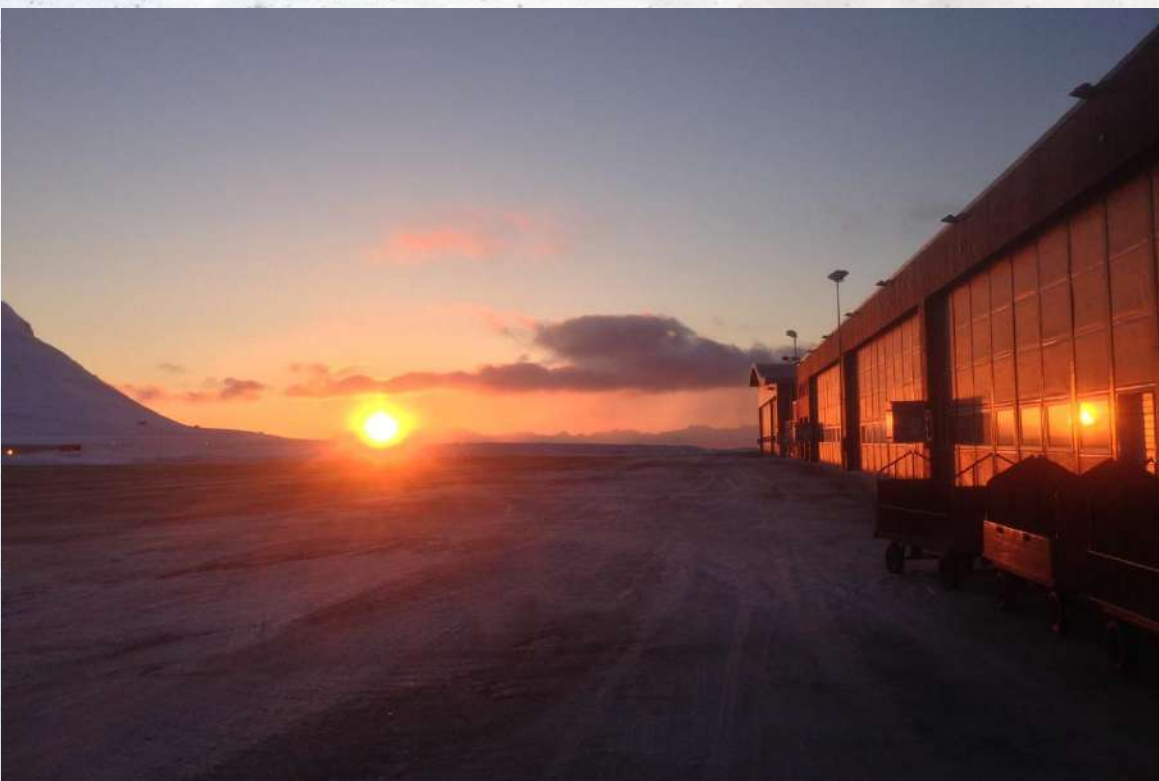
日没のロングイェールビーン空港