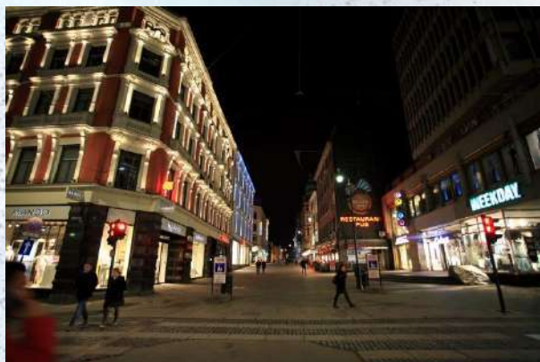
Karl Johans gate