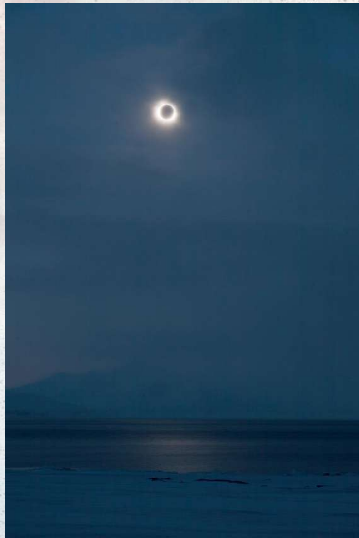
2秒, F8, ISO 100